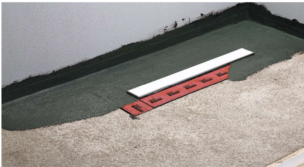
شیب داخل کانال کفشور

با توجه به اینکه آبی که تخلیه می شود ممکن است از درز بین کاشی و بدنه کفشور به مرور زمان به زیر کار کف سرایت کند ما پارچه های ضد آب برای زیر کار در نظر گرفته ایم که تمامی مسائلی که مربوط به ایمنی می باشد را انجام داده باشیم .